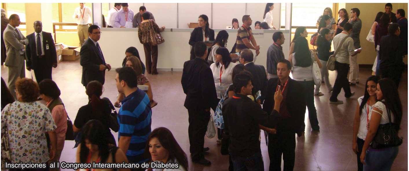
Inscripciones al I Congreso Interamericano de Diabetes