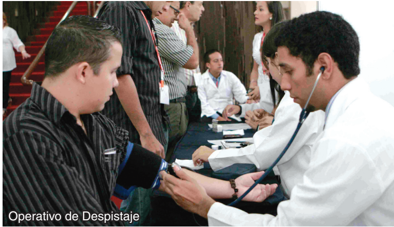
Operativo de Despistaje