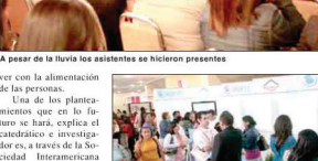
A pesar de la lluvia los asistentes se hicieron presentes

«Me parece que el congreso está muy bien. Hay muchos temas de la diabetes que se están abordando, nada debe de estar aprendiendo. Para mí es importante que se esté haciendo una vez más para quienes padecen la enfermedad, sino para que deba fomentar la