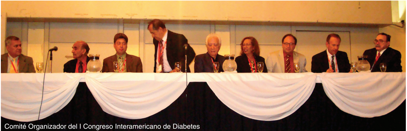
Comité Organizador del I Congreso Interamericano de Diabetes