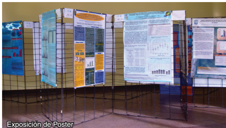
Exposición de Poster