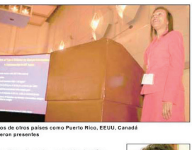
Expertos de otros países como Puerto Rico, EEUU, Canadá se hicieron presentes. «Me parece que el congreso está muy bien. Hay muchos temas de la diabetes que se están abordando, nada debe de estar aprendiendo. Para mí es importante que se esté haciendo una vez más para quienes padecen la enfermedad, sino para que deba fomentar la

«Me parece que el congreso está muy bien. Hay muchos temas de la diabetes que se están abordando, nada debe de estar aprendiendo. Para mí es importante que se esté haciendo una vez más para quienes padecen la enfermedad, sino para que deba fomentar la