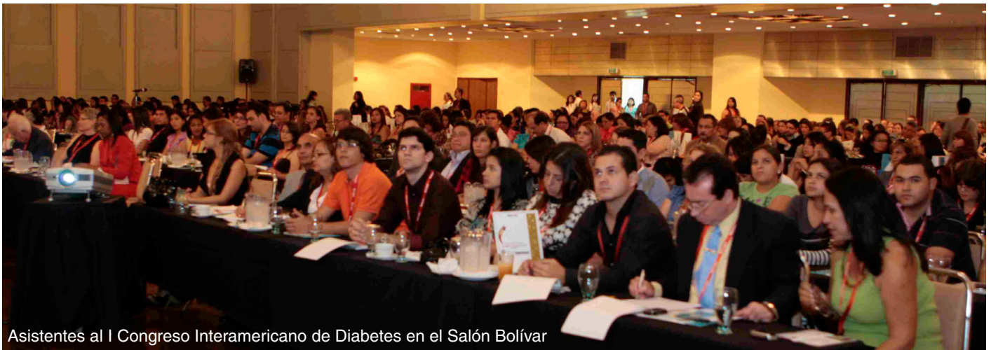
Asistentes al I Congreso Interamericano de Diabetes en el Salón Bolívar