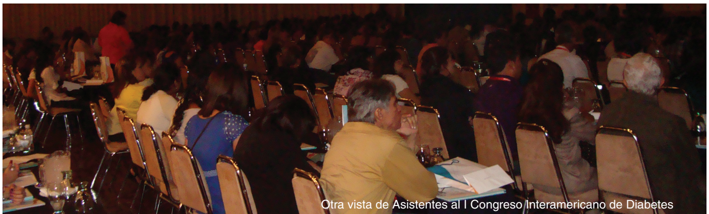
Otra vista de Asistentes al Congreso Interamericano de Diabetes