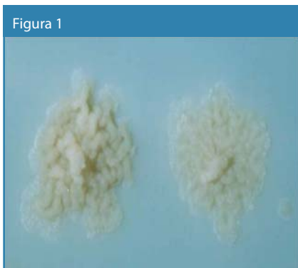
Colonias de Mycobacterium tuberculosis obtenidas en Löwenstein Jensen.

En este estudio se demuestra una vez más el valor diagnóstico del examen por cultivo BAAR, siendo éste más sensible y específico que el procesamiento histológico, además a través el cultivo nos permite obtener un diagnóstico microbiológico certero, llegando hasta la clasificación e identificación del agente etiológico causal de esta patología 14-16 (Figura 1).