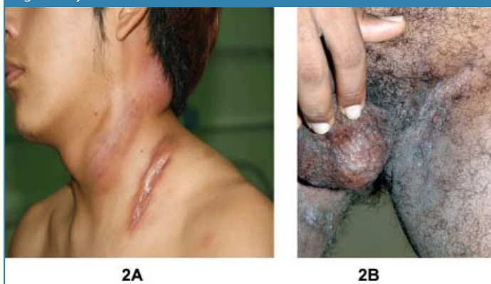
Se observan escrófulas tuberculosas cervicales e inguinales ulcerativas por Mycobacterium avium-intracellulare respectivamente en pacientes VIH +.