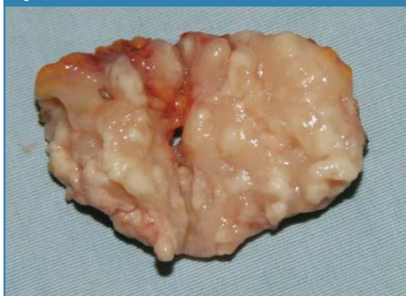
Corte de un ganglio cervical con micro focos caseosos extirpado de paciente VIH+.