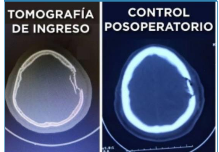
Figura 4. Tomografía simple de cráneo al ingreso, y control posoperatorio en paciente que presentó fractura con hundimiento frontoparietal izquierdo luego de realizar esquirlotomía con levantamiento de fractura y limpieza quirúrgica.

Las complicaciones que se presentaron fueron: infección de herida quirúrgica en 1 caso (5%), pseudomeningocele occipital en 1 caso (5%); parálisis facial en 1 caso (5%) (probablemente asociada a lesión intraparenquimatosas), 1 caso de convulsiones (5%); en el caso de la infección de herida se corrigió con limpieza quirúrgica y antibióticos; el caso de pseudomeningocele occipital se realizó cierre de defecto dural con parche de pericráneo y fascia lata más colocación de sustituto de duramadre, además se administró acetazolamida. El caso de parálisis facial se trató con corticoides y terapia física; en el paciente con convulsiones se trató con antimiconial administrado de manera permanente. Todos los casos evolucionaron satisfactoriamente en los controles subsecuentes.