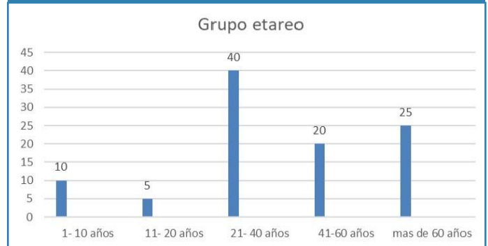
Gráfico 1. Distribución por edad de los pacientes con fracturas craneales que fueron intervenidos quirúrgicamente.

La principal causa de la fractura con hundimiento fue secundaria a accidente de tránsito en 70% de los casos (n=14), 20% por caída de altura (n=8), 5% (n=1) asociado a objeto contundente y 5% (n=1) secundario a arma de fuego. La mayor parte de las lesiones se situaron en la región parietal en 8 casos (40%), 6 casos (30%) en región frontal, 3 casos (15%) en región frontoparietal, 10% (n=2) en región occipital (figura 1) y 1 caso (5%) en región parietotemporal.