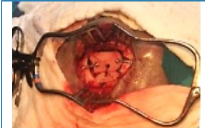
Figura 3. Craneoplastía con hueso autólogo, luego de realizar esquirlotomía más levantamiento de fractura más limpieza quirúrgica.

Todos los pacientes recibieron antibioticoterapia utilizando diversos regímenes terapéuticos, 18 pacientes (90%) recibieron: ceftriaxone, amikacina y clindamicina; 2 casos (10%) recibieron cefazolina. En 8 casos (40%) en las que había lesiones secundarias se administró profilaxis anticonvulsivante con fenitoína, además se administró toxoide tetánico en todos los casos (100%). Se realizó una tomografía de cráneo de control en la totalidad de los pacientes (100%) (Figura 4.)