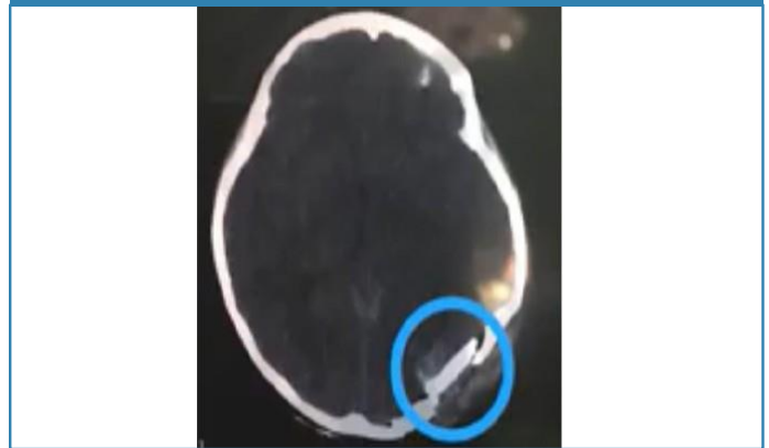
Figura 1. Fractura con hundimiento en región occipital izquierda.

En 30% (n=6) se realizó el diagnóstico a través de rayos x de cráneo AP y lateral y en el 100% (n=20) Tomografía simple de cráneo, con reconstrucción 3D. (Figura 2). Se encontraron lesiones asociadas en 3 casos (hematoma epidural), 2 casos hematoma subdural, 3 casos contusiones cerebrales y 2 casos hemorragia subaracnoidea, 2 casos fistula de LCR.